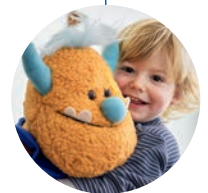
Krankenzusatz- versicherung für kleine Helden

Umfangreicher, individueller Schutz im Bereich Zahn, Ambulant, Stationär oder Krankenhaus- tagegeld sowie Pflege für den Status kleiner Privat- patient:innen